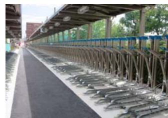
垂直昇降式サイクルラック