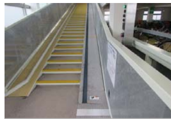
搬送コンベア(自転車用・バイ