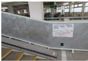
搬送コンベア(自転車用・バイ