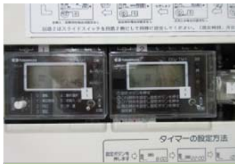
ソーラータイマー