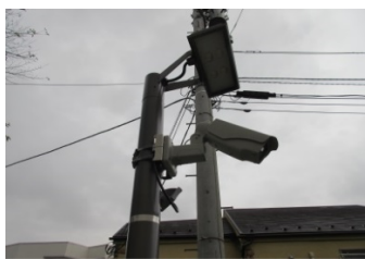
屋外用防犯カメラ