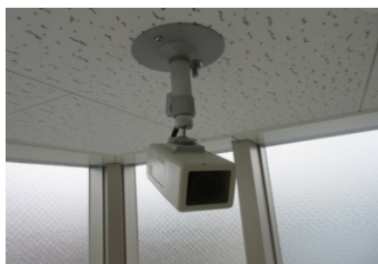
屋内用防犯カメラ