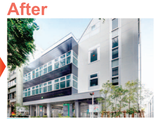
外観 ▶ 美しい景観が実現！